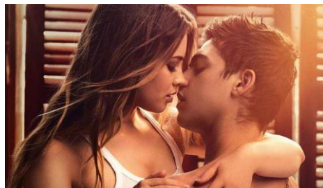
Hardin y Tessa de la saga “After”

En la Edad Media era considerado “pecado” amar de esta manera, de hecho, la Iglesia promovía el amor “fraterno” entre las parejas. A pesar de ello, los Juglares, en la Edad Media, hicieron famoso este tipo de relaciones al cantar de pueblo en pueblo al “Amor cortés”, el cual consistía en relatar las relaciones amorosas a escondidas que mantenían 2 personas fuera del matrimonio, ya que los matrimonios, por entonces, eran contratos que no suponían el amor por el otro.