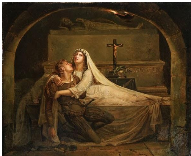
“Romeo y Julieta” de William Shakespeare